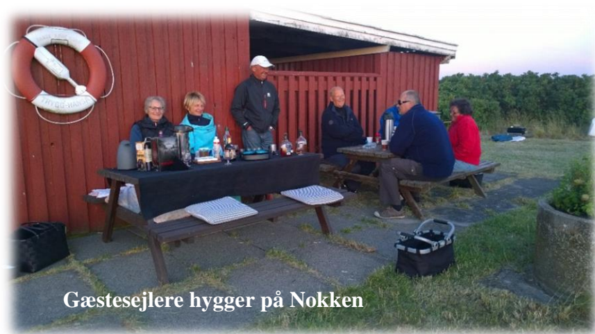
Gæstesejlere hygger på Nokken

Info Center Hals turist bureau, Torvet 7, Hals. 99 31 75 30